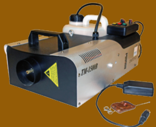
TM1500-B - Thermischer Vernebler