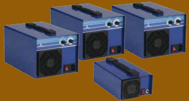
CEBE ® zon - Ozongeneratoren